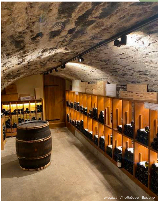
Magasin Vinothèque - Beaune