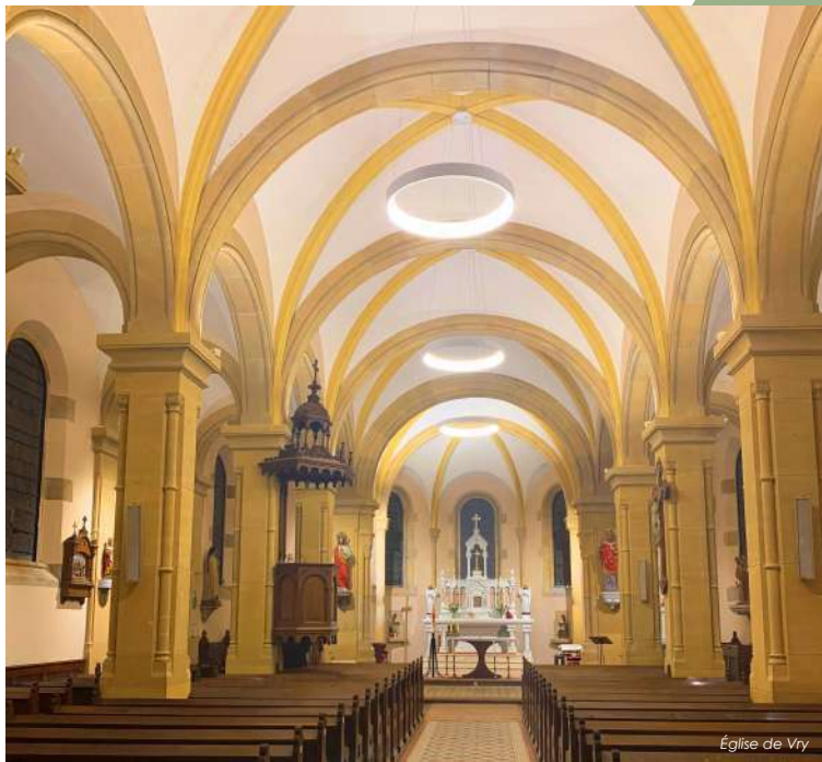
Église de Vry